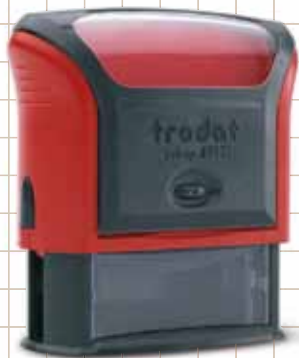
Stempelautomat Trodat 4912 . 47 x 18 mm